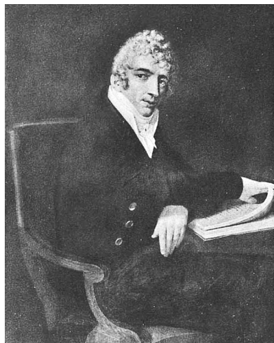
Неизвестный художник. Портрет графа И. С. Лавалья

Лавали становятся владельцами практически всей западной оконечности острова, купив у казны земли между Карповкой и Малой Невкой (по современным границам территория между Песочной наб., ул. Грота и наб. р. Карповки).