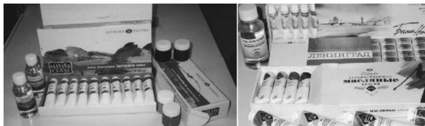
Продукция АО Завода художественных красок «Невская палитра».

мых популярных сувениров из нашего города считались акварельные краски «Ленинград».